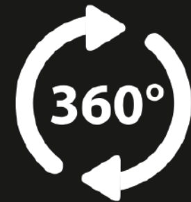
Tour Virtual del edificio

“La incorporación de ANECOIDE , como brazo tecnológico del Grupo, nos ha permitido seguir creciendo y mejorando.”