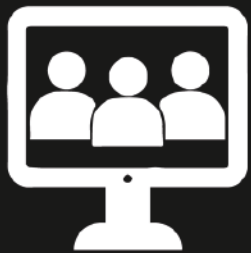
Sistema de Video Conferencias